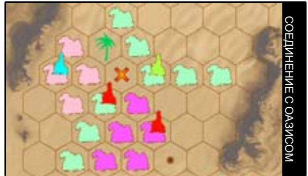
СОЕДИНЕНИЕ С ОАЗИСОМ

Подсказка: Старайтесь хорошо следить за караванами соперников, иначе вы рискуете быть отрезанными от оазисов. Всегда помните о том, что нельзя продолжать свой караван на поле рядом с другим караваном такого же цвета.