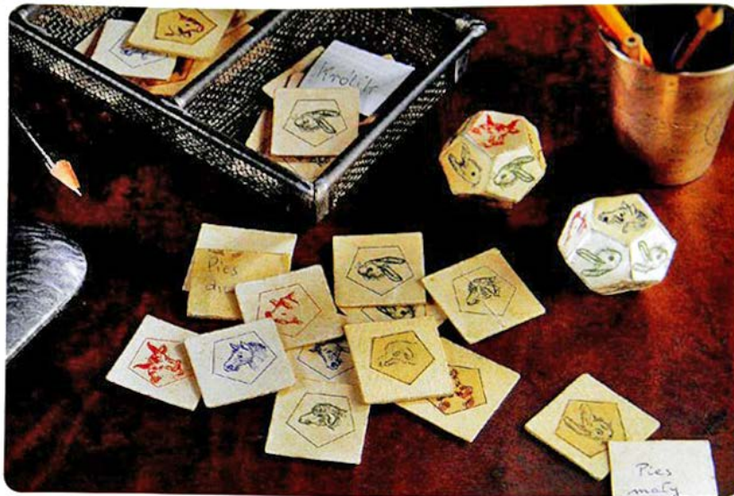
Оригінальна гра "Тваринна ферма" 1943 р.

Оригінальні примірники згоріли в пожежах міста під час Варшавського повстання в серпні 1944 року. На щастя, один примірник зберігся, і через багато років після війни повернувся до родини Борсуків. З нагоди 100-річчя з дня народження пані Зофії Борсук, 25-річчя від дня смерті професора Кароля Борсука та 10-річчя поновлення версії "Тваринної ферми" - "Супер фермер" розважає чергові покоління дітей та батьків. Ми даруємо Вам нову, яскраву, об'ємну, динамічну версію гри. Сподіваємося, що Вам сподобається.