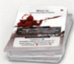
8 карт тактик