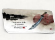
10 карт артефактов