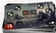
9 карт отрядов орды