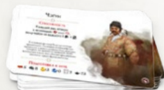
4 карты генералов