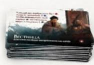
10 карт советников