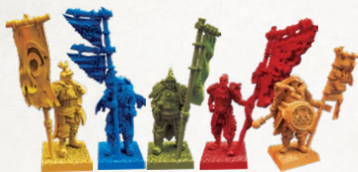
5 знаменосцев (по 1 на игрока)